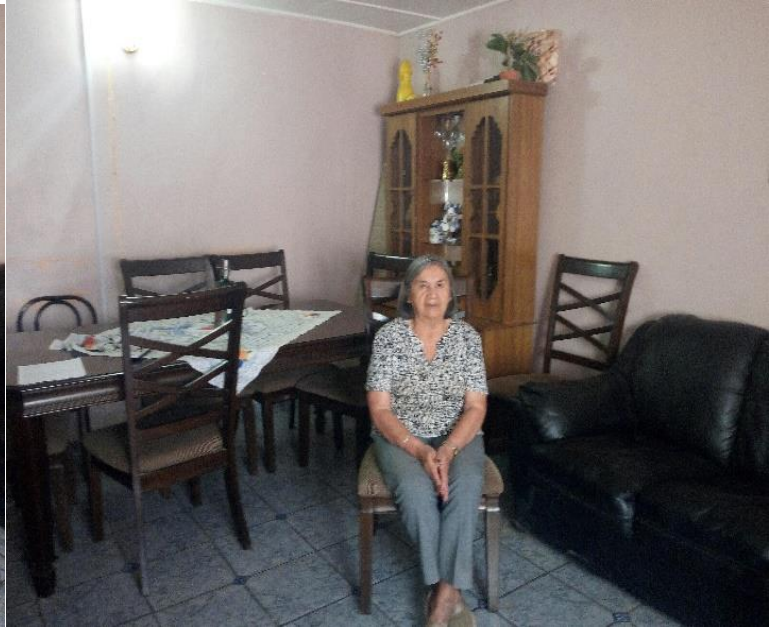
Grupo Focal I: Iquique