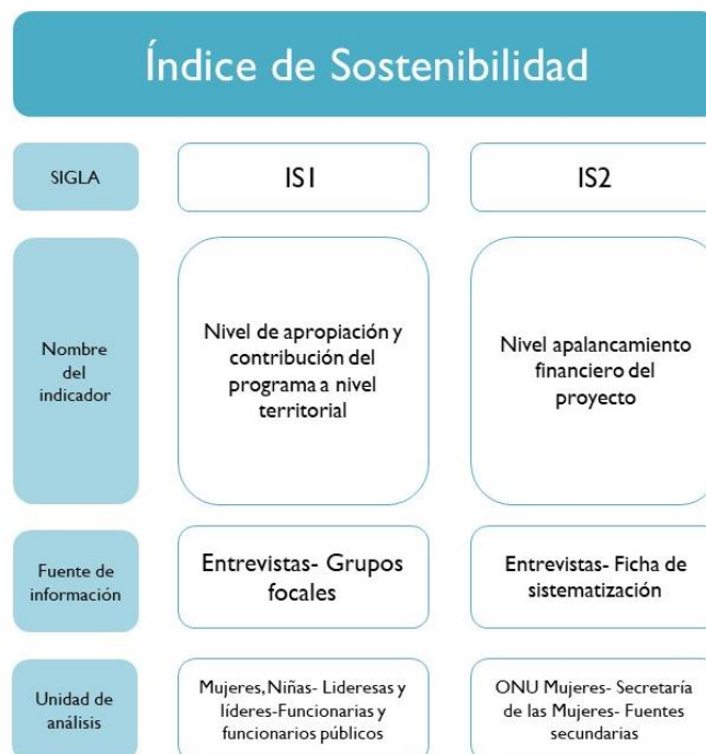
Ilustración 5. Estructura Índice de Sostenibilidad

El índice de Sostenibilidad se evalúa con 2 indicadores. El primero hace referencia a el nivel de apropiación de las personas de las comunas 3, 8, 10, 70 sobre los contenidos e información que brinda el programa. El segundo permite evaluar cómo el programa de Ciudades Seguras ha aportado al fortalecimiento técnico de organizaciones de la sociedad civil e instituciones locales. En la siguiente ilustración se resume el índice de Sostenibilidad, en donde se muestran los indicadores que los componen, sus siglas, el método de recolección de información y las unidades de análisis.