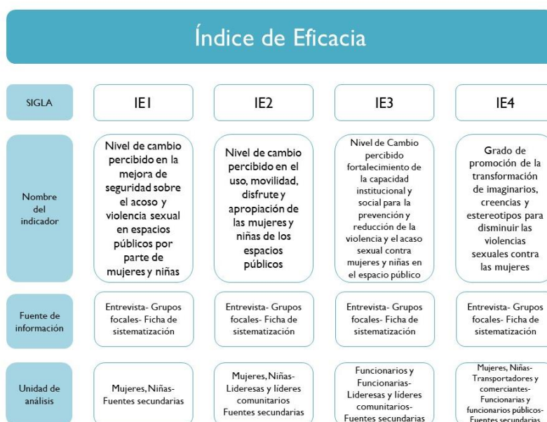
Tabla 14. Ficha Técnica Índice de Eficacia