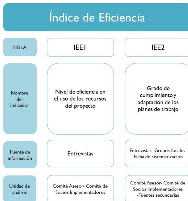
Ilustración 4. Estructura Índice de Eficiencia

ampliar el alcance. El otro indicador, refiere a la eficiencia del programa con relación al cumplimiento de la planeación estratégica y de cronograma años tras año. En la siguiente ilustración se resume el índice de Eficiencia, en donde se muestran los indicadores que los componen, sus siglas, el método de recolección de información y las unidades de análisis.